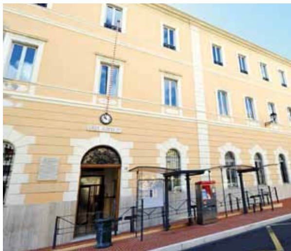
Le Lycée Albert 1 er , situé à Monaco-Ville