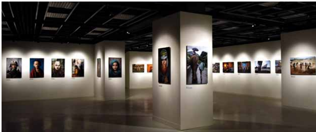
« Regards » de Steve McCurry, à la Salle d'Exposition du Quai Antoine 1 er , du 15 octobre au 11 novembre 2015 de 13h à 19h (fermé le lundi). Renseignements : 98 98 83 03.

La Direction des Affaires Culturelles (DAC) inaugurerait, le 14 octobre dernier, une exposition du célèbre photographe Steve McCurry. Cent photographies, et parmi elles, les images les plus emblématiques de l'artiste, sont exposées jusqu'au 11 novembre dans la Salle d'Exposition du quai Antoine 1 er . Contrat, budget, montage...le JDA vous guide dans les coulisses d'une exposition prestigieuse.