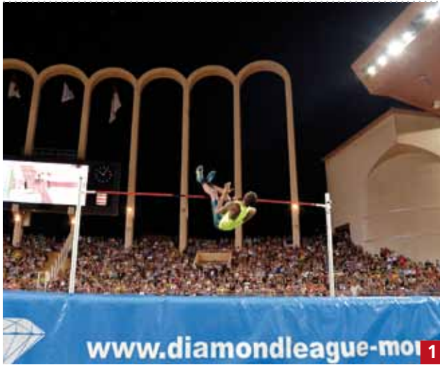
Le Stade Louis II le 17 juillet dernier