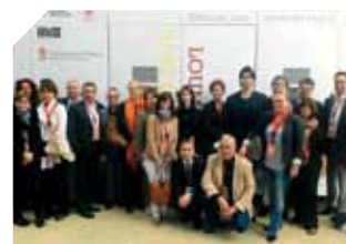
DREC – Une délégation de cadres de l'Administration à « Milano 2015 »