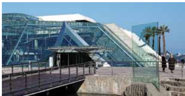
La grande exposition estivale du Grimaldi Forum « De Chagall à Malevitch - La révolution des avant-gardes » a réuni 38.000 visiteurs soit 7.000 de plus que celle de l'été dernier. Encore un incontestable succès pour « 2015, Année de la Russie en Principauté »

Au palmarès des nationalités les plus représentées en Principauté lors de la saison estivale (juin-août), on retrouve la France (+4,5%) et le Royaume-Uni (+7,5%). L'Arabie Saoudite (+24%), la Chine (+24,5%) et Israël (+15%), qui ont toutes vu leur taux de fréquentation progresser, participent également de manière importante à ce très bon résultat. « Il faut souligner l'équilibre entre des marchés mûrs et des marchés émergents » précise Guy Antognelli.