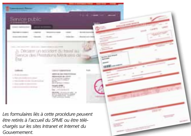
Les formulaires liés à cette procédure peuvent être retirés à l'accueil du SPME ou être téléchargés sur les sites Intranet et Internet du Gouvernement.