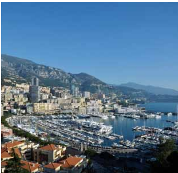
Le port de la Principauté est de plus en plus attractif, la digue Rainier III a ainsi accueilli 97 759 croisiéristes cet été, soit une hausse de 33% par rapport à 2014.