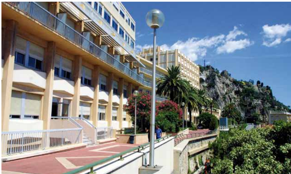
Les consultations du médecin tabacologue ont lieu les lundis, mercredis, jeudis et vendredis après-midis au Service de Pneumologie du CHPG (téléphone : 97.98.97.41). Le nombre de consultations est stable avec, en moyenne, 350 consultations par an.

Le 9 mai 2008 une loi relative à la lutte contre le tabagisme entrain en vigueur en Principauté. Les principales mesures de cette législation concernent l'interdiction de fumer dans des locaux à usage collectif, la prévention et la protection de la jeunesse mais aussi la mise en place d'une consultation de tabacologie au sein d'un établissement de santé public. Sept ans plus tard, nous avons souhaité