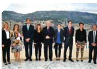
ME – La nouvelle promotion de la FSA