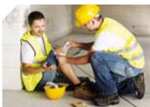
DASS – Accident du travail : la nouvelle procédure du SPME