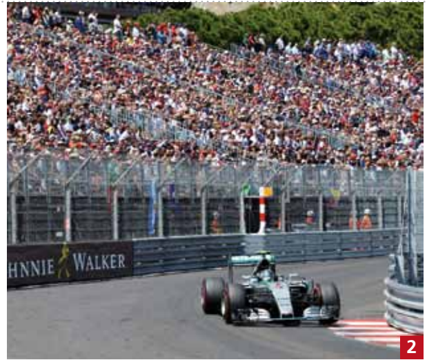
La « Flèche d'Argent » avant le virage Louis Chiron le 24 mai dernier