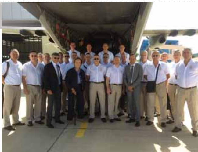
Avant de repartir vers Monaco, l'Orchestre a posé pour la postérité avec Alix de Foresta, Princesse Napoléon.

L'Orchestre a ensuite défilé lors de la passation de commandement avant d'interpréter une aubade musicale sur des airs de fantasia durant le repas qui réunissait les officiels, les familles et les militaires du Régiment.