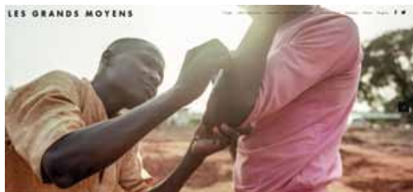
Les contenus sont diffusés de façon multimodale (site web, web documentaire, exposition itinérante, objet éditorial). Plus d'informations sur le site Internet : lesgrandsmoyens.fr Retrouvez également le web-documentaire sur le site « lesgrandsmoyens.org ». Celui-ci sera prochainement diffusé sur les sites lemonde.fr et RFI.fr

Pour en savoir plus : www.lesgrandsmoyens.fr