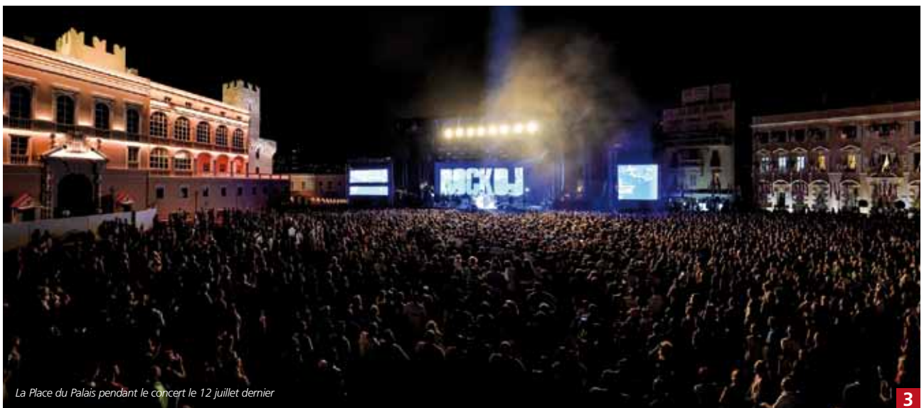
La Place du Palais pendant le concert le 12 juillet dernier

3 A l'occasion des dix ans de Règne du Prince Souverain, Robbie Williams fait le « show » devant des milliers de Monégasques conquis.