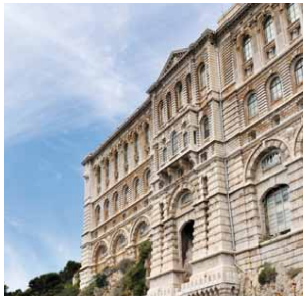
Le Musée océanographique a également enregistré une hausse de sa fréquentation, recevant ainsi 282 688 visiteurs (+3%) entre juin et août.

Même phénomène dans les nationalités en recul : Émirats Arabes Unis (-17,4%), Liban (-18,9%) sur des volumes assez restreints. Cependant, après un été 2014 relativement stable, l'Italie perd encore 7% de fréquentation. Enfin, les marchés russe et ukrainien qui sont en grande difficulté dans le monde entier