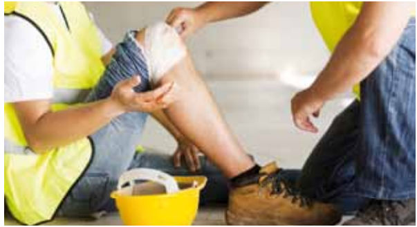
En 2014, le SPME a traité : 252 déclarations, dont 17 ont fait l'objet d'un refus ; 5 rechutes, dont 1 a fait l'objet d'un refus. La population concernée représente 3631 personnes (1431 femmes et 2197 hommes).

Après analyse par le SPME des informations en sa possession, une convocation de la victime au Service Médical de cette entité peut être décidée.