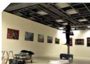
INT – Dans les coulisses d'une exposition